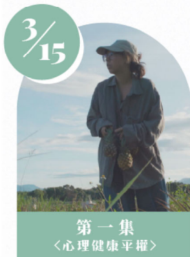
第一集 〈心理健康平權〉