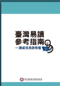
臺灣易讀參考指南 —讓資訊易讀易懂