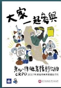
2017年CRPD 結論性意見易讀版手冊