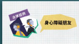
身心障礙者法律扶助專案