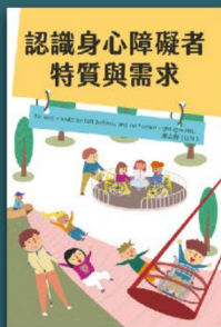
認識身心障礙者 特質與需求