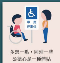
不占用身心障礙者 專用停車位