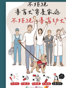
不拒絕導盲犬寄養家庭 不拒絕導盲幼犬