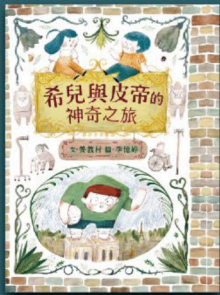
希兒與皮蒂的神奇之旅 臺灣手語繪本