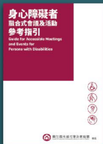
身心障礙者 融合式會議參考指引